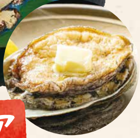
あわびのバター焼き

南三陸町は良質な天然あわびの産地。刺身のコリコリ食感やふっくらとした蒸し焼きなどのメニューで、特別なひとときを堪能できます。