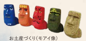
お土産づくり(モアイ像)