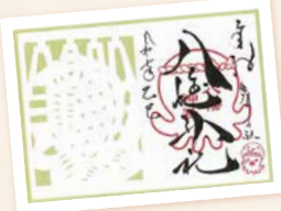
月替わりきりご御朱印