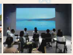
震災伝承館「南三陸311メモリアル」 ラーニングプログラム