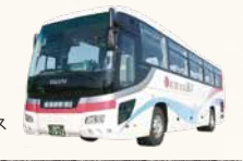
無料シャトルバス

オーシャンビューの客室や地元食材を中心とした新鮮なお料理が人気。仙台駅からの無料シャトルバスも毎日運行しています。