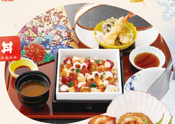
南三陸キラキラ 冬のみかくづくし

南三陸町自慢のA級グルメ、四季を彩る丼。旬の海産物が贅沢に盛り付けられ、彩りと味わいを存分に楽しめます。