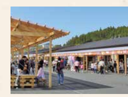
南三陸さんさん商店街