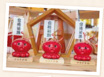
ゆめ多幸鎮 オクトパス君

TEL 986-0782 宮城県本吉郡南三陸町入谷字中の町227番地 0226-46-5153 (南三陸YES工房)