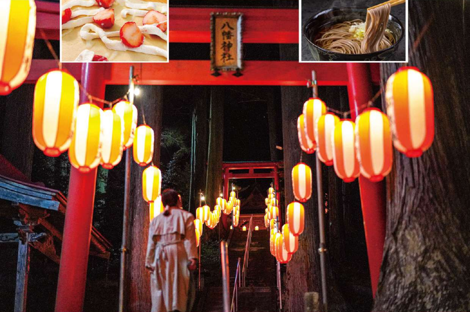
入谷小学校 / 廻館習字教室の生徒さんの習字作品を灯籠にして境内参道にお飾りします。(大晦日限定)