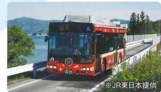
BRT(バス高速輸送システム)