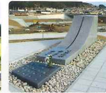
祈りの丘・名簿安置の碑