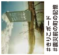
#きりこボード #震災前の町の記憶

南三陸ポータルセンター #観光協会 #モアイ顔出し看板 #みなみな屋 #震災アーカイブ展示