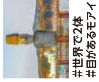
#世界で2体 #目があるモアイ