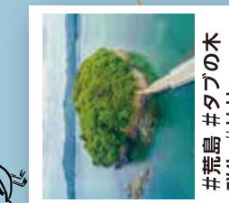
#荒島 #タブの木 #群生 #神社