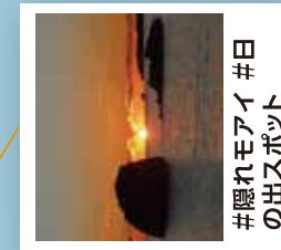
#隠れモアイ #日 の出スポット