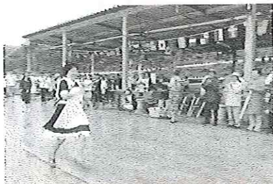
障害物競走では楽しい衣装も!

■主催:NPO法人田の浦ファンクラブ/田の浦契約会 ■協力:NPO法人夢未来南三陸/滋賀県立大学近江楽座 田の浦FC学生サポートチーム&木興プロジェクト/東北福祉大学/立ち上がり! 飯能プロジェクト/NPO法人GreenWorks/NPO法人大森まちづくりカフェ ■後援:南三陸町/南三陸町観光協会