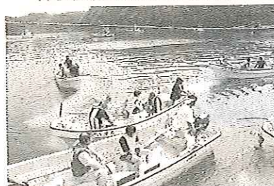
ウニ採り競争は参加者が漁師さんとチームを組んで挑戦します!