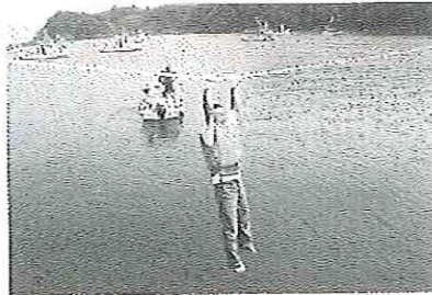
海の綱渡りは優勝者に賞品が!