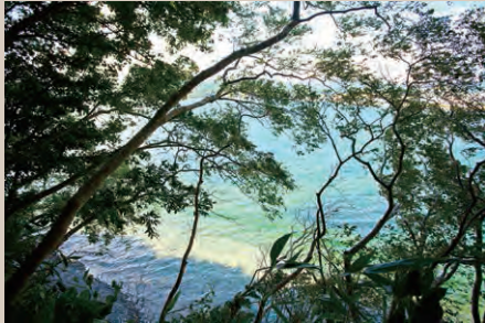
▲遊歩道から鮮やかなブルーの海を臨む。