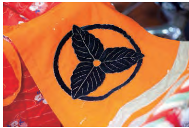
▲山内家の家紋が入った昭和期の古い衣装。シンプルだが気品があり力強い。