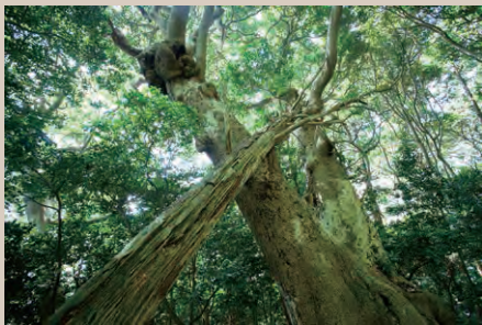
▲タブノキの大木が会話しているかのようだ。

There is a “miracle” forest in Minamisanriku. It lies in an area at the northern limit of the range of broad and glossy leaved evergreen trees. Although the Tohoku region is in a cold climate, this forest is thick and green all year round with evergreen trees of Tabunoki ( Machilus thunbergii ) and Mochinoki ( Ilex integra ), which are found in the southern area. In the undergrowth, small evergreen trees such as Japanese cleyera and camellia japonica, and evergreen shrubs such as spindletrees, and autumn ferns grow densely packed.