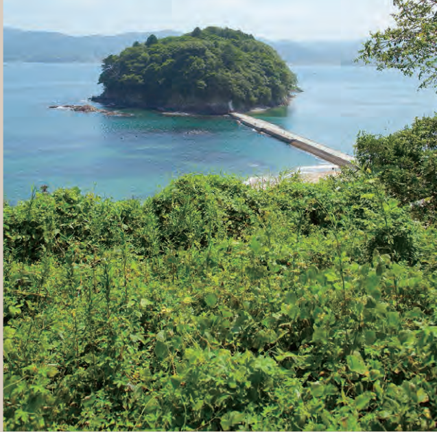
▲志津川湾に浮かぶ荒島。

The entire boundary of Minamisanriku is mountain ridgelines. All the rain that falls on the town goes to the sea. There is a grand view of rich mountains that nurture the blessings of a bountiful sea, a marvelous view of a beautiful ria coast line ... islands floating in the bay ... Surprising spectacles await us at the edge of Minamisanriku.