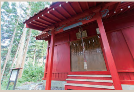
▲荒島の山道を登り切ると荒島神社にたどり着く。