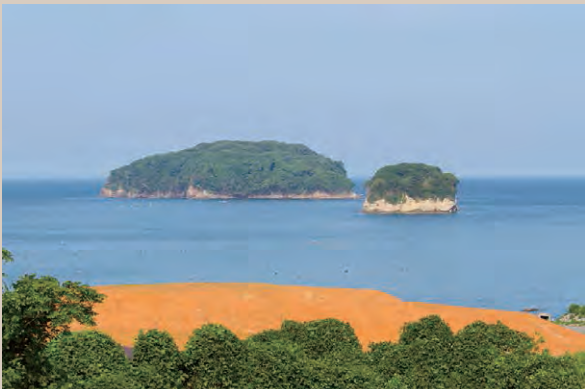
▲左側が志津川湾に浮かぶ天然記念物の樺島。別名は青島。右側は天女伝説が伝わる竹島。

島には荒島神社が祀られている。神社にお参りし、島を一周すると、エメラルドブルーの海、タブノキの大木など、次々と自然の創り出す神秘的な美に出会える。荒島は南三陸が誇るパワースポットだ。