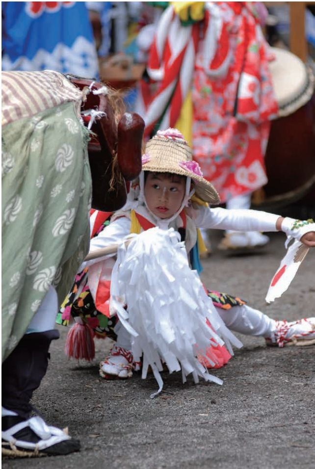
あやし ▲打囃子をもちあげる表情豊かな獅子の愛子役の演技。