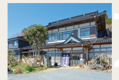
漁家民宿やすらぎ