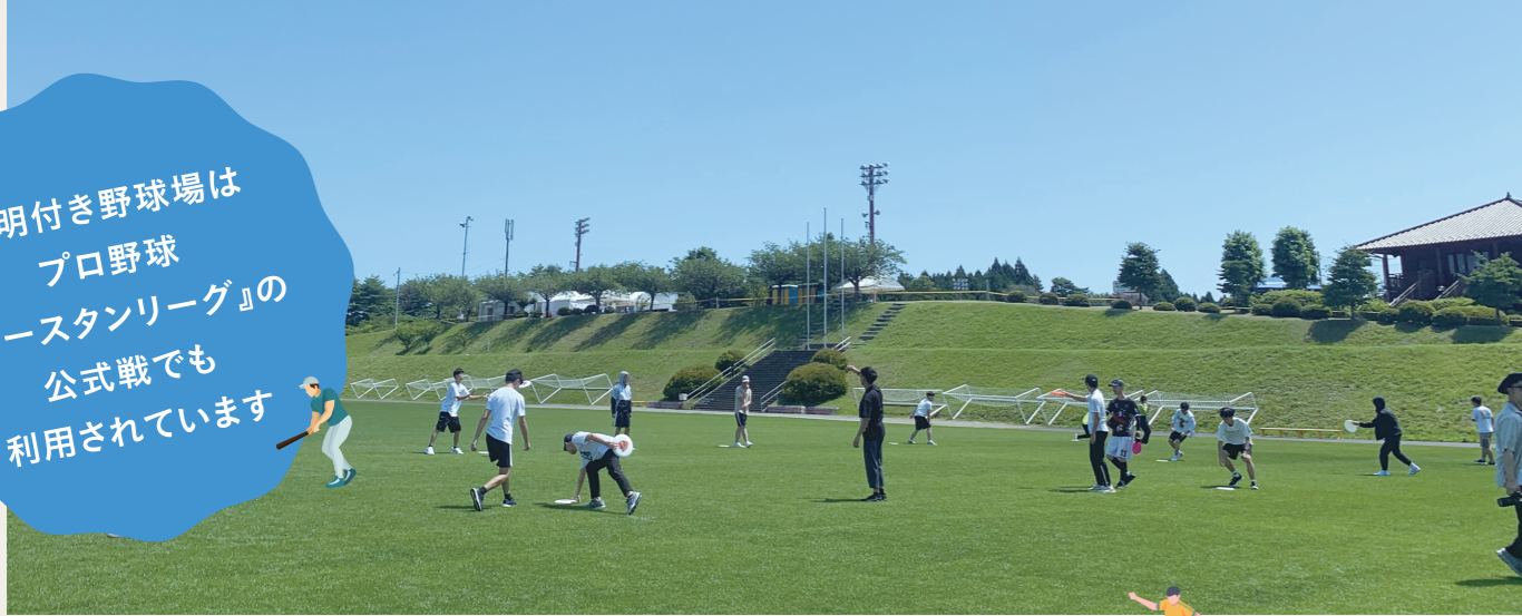
全面芝の多目的運動場

照明付き野球場は プロ野球 『イースタンリーグ』の 公式戦でも 利用されています