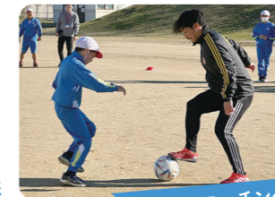
サッカーコーチング