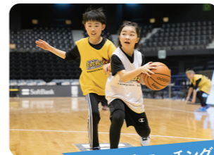
バスケットコーチング