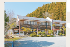
校舎の宿さんさん館