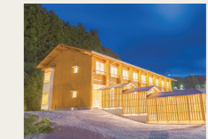
南三陸まなびの里いりやど