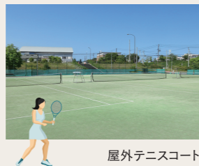
屋外テニスコート