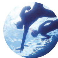
志津川湾 スノーケリング