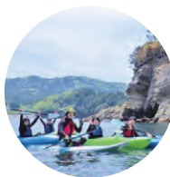
志津川湾 シーカヤック

志津川湾での自然体験を通して、海を実感し環境を学びます。座ったままの姿勢でパドルを漕ぎ進むシーカヤック、ボードの上に乗って乗り、風を感じながらバランスをとる SUP などの潮の香りに包まれながら、豊かに茂る海藻の森や行きかう野鳥を観察し、漁業などの営みを理解します。