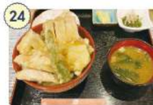
24 食飲笑うたつがね

☑ 11:00~14:00 ※土・日は11:00~13:00 17:30~22:00 (LO.21:30) ☑ 水曜日 ☎ 0226-28-9107