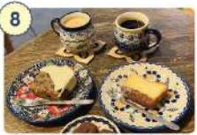
8 雑貨と珈琲の店サタケ

☑ 9:00~18:00 (店内喫茶17:00まで) ☑ 火曜日 ☎ 0226-46-3202