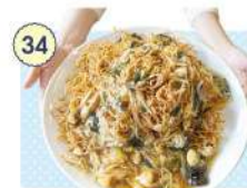
34 農漁家レストラン 松野や