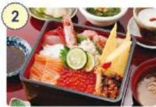
2 かいせんどころ 梁

☑ 11:00~14:00、 17:00~21:00 (LO.20:30) ☑ 月曜日、日曜日 ☎ 0226-29-6343