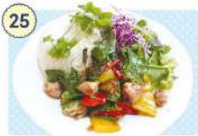
25 和sian-cafe aimaki

☑ 11:00~14:00 ※土・日は11:00~13:00 17:30~22:00 (LO.21:30) ☑ 水曜日 ☎ 0226-28-9107