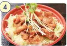
4 井専門店海たらう

☑ 11:00~14:00、 17:00~21:30 ☑ 火曜日、月曜日 ☎ 0226-46-1087