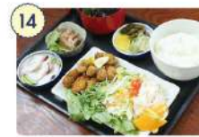
14 食事処 たけや

☑ 11:00~14:00、 17:00~19:30 ☑ 水曜日 ☎ 0226-47-1688