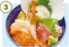
3 食楽 しお彩

☑ 11:00~(LO.14:00) 17:00~(LO.21:00) ☑ 水曜日 ☎ 0226-25-7126