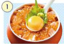
1 創菜旬魚 はしもと

☑ 11:00~14:00、 17:00~21:00 (LO.20:30) ☑ 月曜日、日曜日 ☎ 0226-29-6343