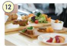
12 南三陸ワイナリー

☑ 11:00~14:00、 17:00~21:00 (LO.20:00) ☑ 月曜日 (祝日の場合翌日) ☎ 0226-46-2433