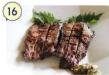
16 今度は居酒屋だよ!! 日の出荘

☑ 17:30~23:00 (LO.22:30) ☑ 月曜日 ☎ 0226-29-6466