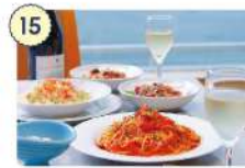
15 レストラン シーサイド

☑ 11:00~14:00、 17:00~21:30 ※夜の部休業中 ☑ 不定休 ☎ 090-8424-2766