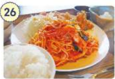
26 レストラン平成の森

☑ 11:00~14:00、17:00~19:00 ※19:00以降予約制 ☑ 水曜日、不定休あり ☎ 0226-29-6809