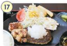
17 ランチ&カフェ リッチー

☑ 17:30~23:00 (LO.22:30) ☑ 月曜日 ☎ 0226-29-6466